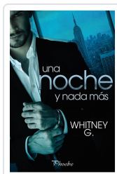
UNA NOCHE Y NADA MÁS G. WHITNEY