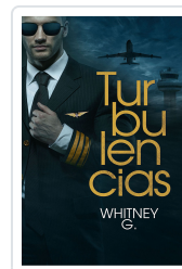
TURBULENCIAS G., WHITNEY