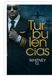
TURBULENCIAS G., WHITNEY