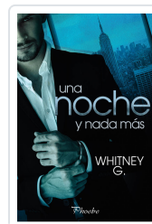
UNA NOCHE Y NADA MÁS G. WHITNEY