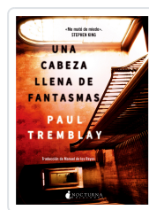
UNA CABEZA LLENA DE FANTASMAS TREMBLAY, PAUL