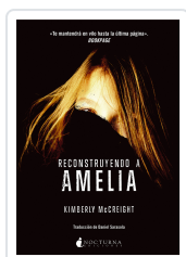
RECONSTRUYENDO A AMELIA MCCREIGHT, KIMBERLY