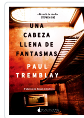
UNA CABEZA LLENA DE FANTASMAS TREMBLAY, PAUL