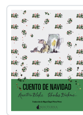
CUENTO DE NAVIDAD DICKENS, CHARLES