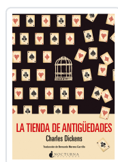
LA TIENDA DE ANTIGÜEDADES DICKENS, CHARLES