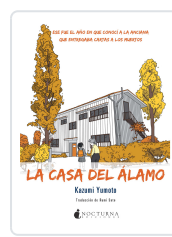
LA CASA DEL ÁLAMO YUMOTO, KAZUMI