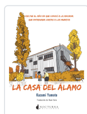
LA CASA DEL ÁLAMO YUMOTO, KAZUMI