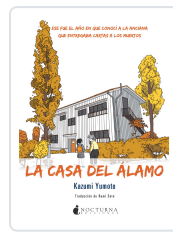
LA CASA DEL ÁLAMO YUMOTO, KAZUMI