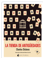
LA TIENDA DE ANTIGÜEDADES DICKENS, CHARLES