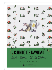
CUENTO DE NAVIDAD DICKENS, CHARLES