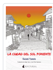
LA CIUDAD DEL SOL PONIENTE YUMOTO, KAZUMI