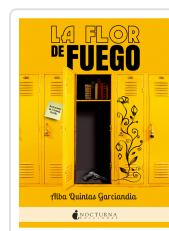
LA FLOR DE FUEGO QUINTAS GARCÍANDIA, ALBA