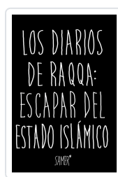
LOS DIARIOS DE RAQQA: ESCAPAR DEL ESTADO ISLÁMICO ISLÁMICO SAMER