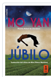
JÚBILO YAN, MO