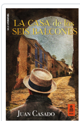
LA CASA DE LOS SEIS BALCONES CASADO FLORES, JUAN