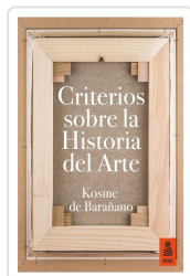
CRITERIOS SOBRE LA HISTORIA DEL ARTE DE BARAÑANO LETAMENDIA, KOSME