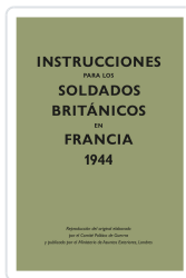
INSTRUCCIONES PARA LOS SOLDADOS BRITANICOS EN FRANCIA, 1944 MINISTERIO DE ASUNTOS EXTERIORES