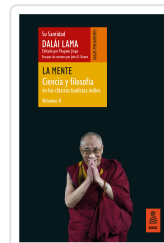
LA MENTE (CIENCIA Y FILOSOFÍA EN LOS CLÁSICOS BUDISTAS INDIOS, VOL. II) LAMA, DALÁI