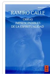
OBRAS IMPRESCINDIBLES DE LA ESPIRITUALIDAD CALLE CAPILLA, RAMIRO