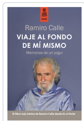
VIAJE AL FONDO DE MÍ MISMO (3ª ED.) CALLE CAPILLA, RAMIRO