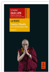
LA MENTE (CIENCIA Y FILOSOFÍA EN LOS CLÁSICOS BUDISTAS INDIOS, VOL. II) LAMA, DALÁI