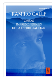
OBRAS IMPRESCINDIBLES DE LA ESPIRITUALIDAD CALLE CAPILLA, RAMIRO