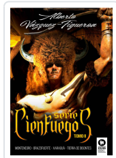
SERIE CIENFUEGOS TOMO II VÁZQUEZ-FIGUEROA, ALBERTO