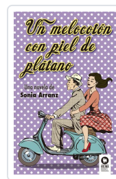
UN MELOCOTÓN CON PIEL DE PLÁTANO ARRANZ MORENO, SONIA