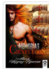
MEMORIAS DE CIENFUEGOS VÁZQUEZ-FIGUEROA, ALBERTO