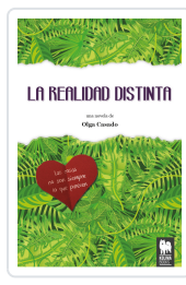
LA REALIDAD DISTINTA CASADO, OLGA