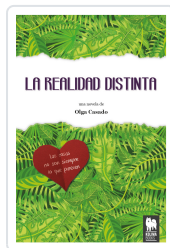
LA REALIDAD DISTINTA CASADO, OLGA