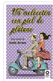
UN MELOCOTÓN CON PIEL DE PLÁTANO ARRANZ MORENO, SONIA