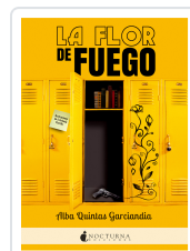
LA FLOR DE FUEGO QUINTAS GARCÍANDIA, ALBA