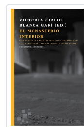
EL MONASTERIO INTERIOR CIRLOT VALENZUELA, VICTORIA; GARÍ AGUILERA, BLANCA; RAININI, MARCO; TAUSIET CARLÉS, MARÍA; BRUZELIUS, CA