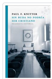
SIN BUDA NO PODRÍA SER CRISTIANO KNITTER, PAUL F.