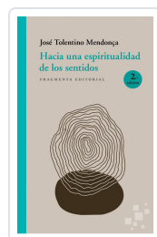
HACIA UNA ESPIRITUALIDAD DE LOS SENTIDOS TOLENTINO MENDONÇA, JOSÉ