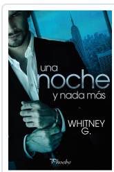
UNA NOCHE Y NADA MÁS G. WHITNEY