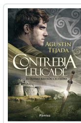
CONTREBIA LEUCADE TEJADA NAVAS, AGUSTÍN