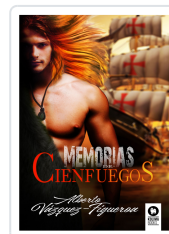
MEMORIAS DE CIENFUEGOS VÁZQUEZ-FIGUEROA, ALBERTO