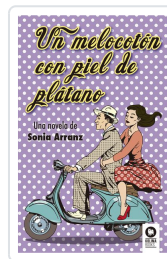
UN MELOCOTÓN CON PIEL DE PLÁTANO ARRANZ MORENO, SONIA