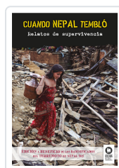
CUANDO NEPAL TEMBLÓ VARIOS AUTORES