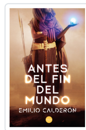
ANTES DEL FIN DEL MUNDO EMILIO CALDERÓN