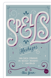
SPELLS (HECHIZOS) GINER, ELIA