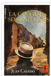
LA CASA DE LOS SEIS BALCONES CASADO FLORES, JUAN