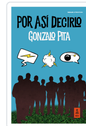
POR ASÍ DECIRLO PITA, GONZALO