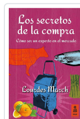
LOS SECRETOS DE LA COMPRA MARCH FERRER, LOURDES