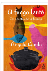
A FUEGO LENTO LANDA APARICIO, ÁNGELA