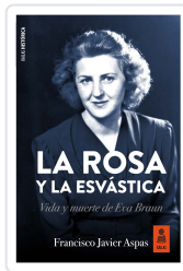
LA ROSA Y LA ESVÁSTICA ASPAS TRAVER, FRANCISCO JAVIER