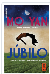
JÚBILO YAN, MO