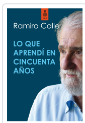
LO QUE APRENDÍ EN CINCUENTA AÑOS (6ª ED.) CALLE CAPILLA, RAMIRO