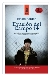
EVASIÓN DEL CAMPO 14 (5ª ED.) HARDEN, BLAINE