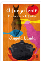
A FUEGO LENTO LANDA APARICIO, ÁNGELA