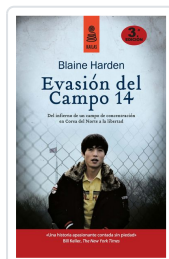
EVASIÓN DEL CAMPO 14 (5ª ED.) HARDEN, BLAINE