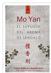
EL SUPICIO DEL AROMA DE SÁNDALO (3ª ED.) YAN, MO