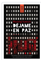
DÉJAME EN PAZ XUECUN, MURONG