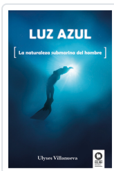
LUZ AZUL VILLANUEVA TOMAS, ULYSES