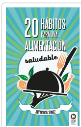
20 HÁBITOS PARA UNA ALIMENTACIÓN SALUDABLE RUIZ GÓMEZ, AMPARO