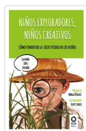
NIÑOS EXPLORADORES, NIÑOS CREATIVOS LÓPEZ BAYARRI, GUZMÁN