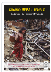
CUANDO NEPAL TEMBLÓ VARIOS AUTORES