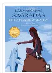
LAS MASCARAS SAGRADAS DE LA ISLA DE WAKAHAY DIAZ SERRANO, JOSE