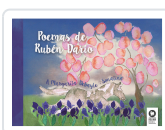
POEMAS DE RUBÉN DARÍO DARÍO, RUBÉN