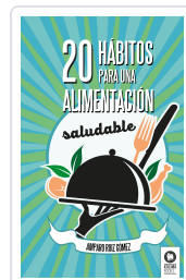
20 HÁBITOS PARA UNA ALIMENTACIÓN SALUDABLE RUIZ GÓMEZ, AMPARO