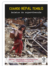
CUANDO NEPAL TEMBLÓ VARIOS AUTORES