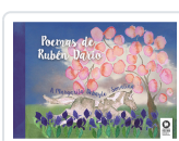
POEMAS DE RUBÉN DARÍO DARÍO, RUBÉN