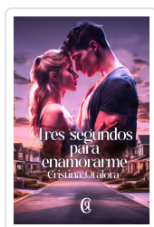
TRES SEGUNDOS PARA ENAMORARME CRISTINA OTÁLORA