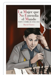
LA MUJER QUE NO ENTENDÍA EL MUNDO TORRES, DAVID