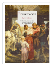
RESURRECCIÓN TOLSTÓI, LEV