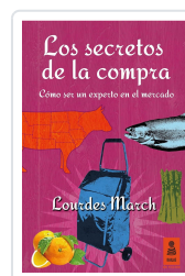
LOS SECRETOS DE LA COMPRA MARCH FERRER, LOURDES