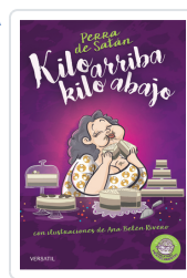
PERRA DE SATÁN, KILO ARRIBA, KILO ABAJO PERRADESATÁN