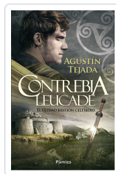
CONTREBIA LEUCADE TEJADA NAVAS, AGUSTÍN