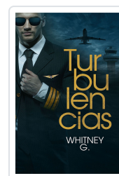
TURBULENCIAS G., WHITNEY