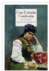
UNA EXTRAÑA CONFESIÓN CHÉJOV, ANTON