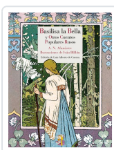
BASILISA LA BELLA Y OTROS CUENTOS POPULARES RUSOS AFANÁSIEV, ALEKSANDR NIKOLÁYEVICH