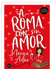
A ROMA SIN AMOR ADAIR, MARINA