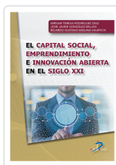
CAPITAL SOCIAL, EMPRENDIMIENTO E INNOVACIÓN ABIERTA EN EL SIGLO XXI, EL GONZALEZ MILLAN, JOSE JAVIER